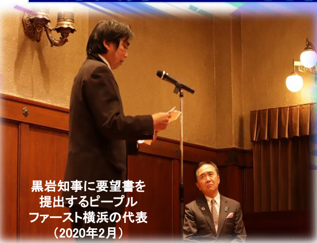
黒岩知事に要望書を提出するピープルファースト横浜の代表 (2020年2月)