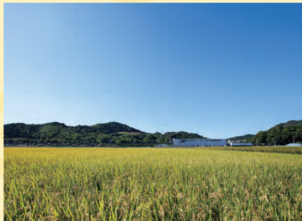
久原本家グループ本社