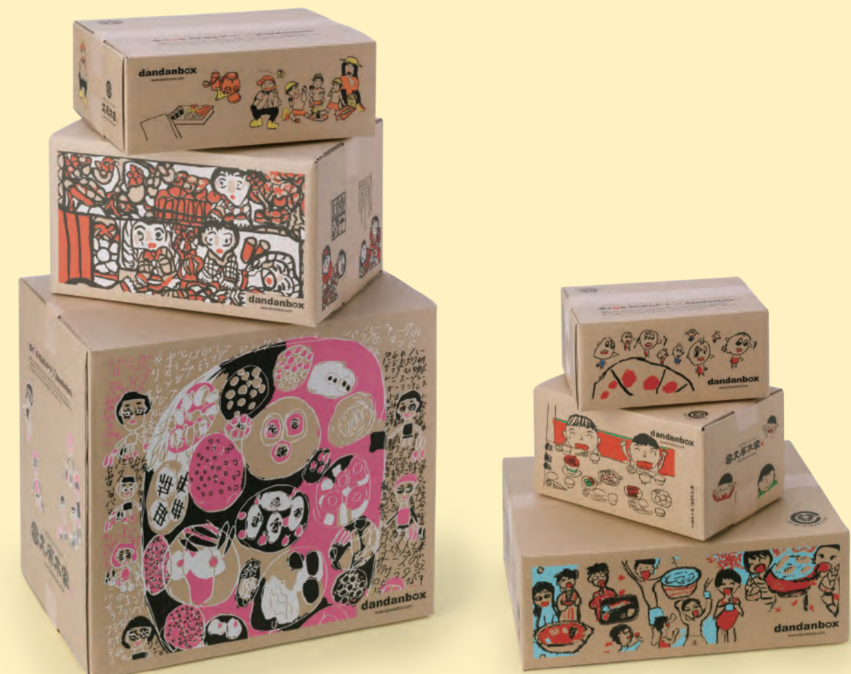
※ダンボールの画像は2017年度のものです。