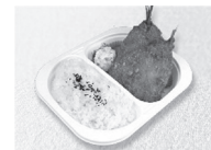
ホッケフライ弁当