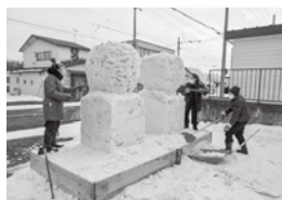
（NPO法人新得町共同作業所）

今年当初雪不足で思うように作業ができず、付近から雪集めをして雪像作りを行っていましたが、完成直前に大雪に遭い、2日間除雪作業のため作業が中断。準備は開会前日の深夜までかかり、作業完了したのは当日の午前中でした。再チェックする間もなく、開会の準備をする慌ただしい一日でした。